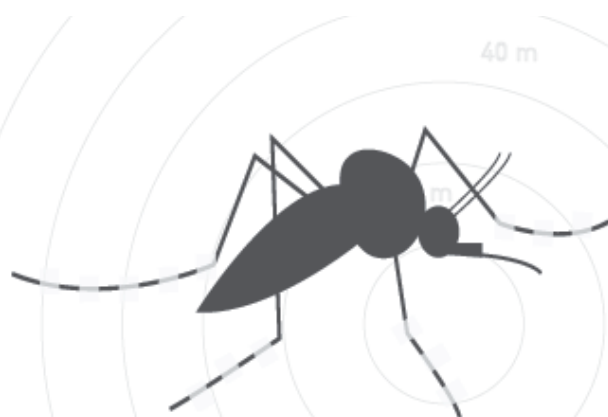
Zanzara Tigre Aedes albopictus