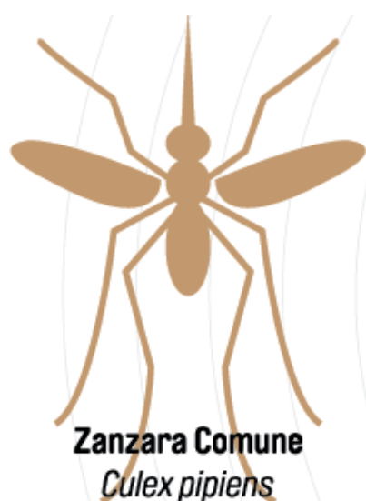
Zanzara Comune Culex pipiens